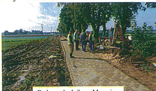
Budowa chodnika w Mszanie