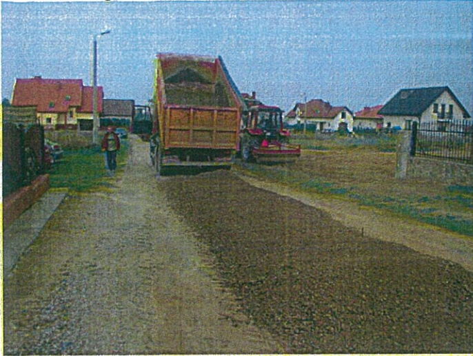
Nawożenie materiału na drogi osiedlowe w Cielętach