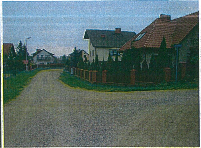
Drogi osiedlowe w Kruszynkach po remoncie